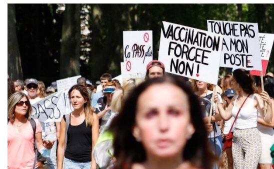
Ya son cuatro sábados que en diferentes ciudades de Francia, los ciudadanos, salen a la calle a protestar por la obligatoriedad de la vacuna.