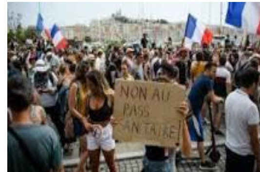
En la imagen, protestantes piden a Macron, presidente de Francia, que no se imponga el Pase Sanitario.